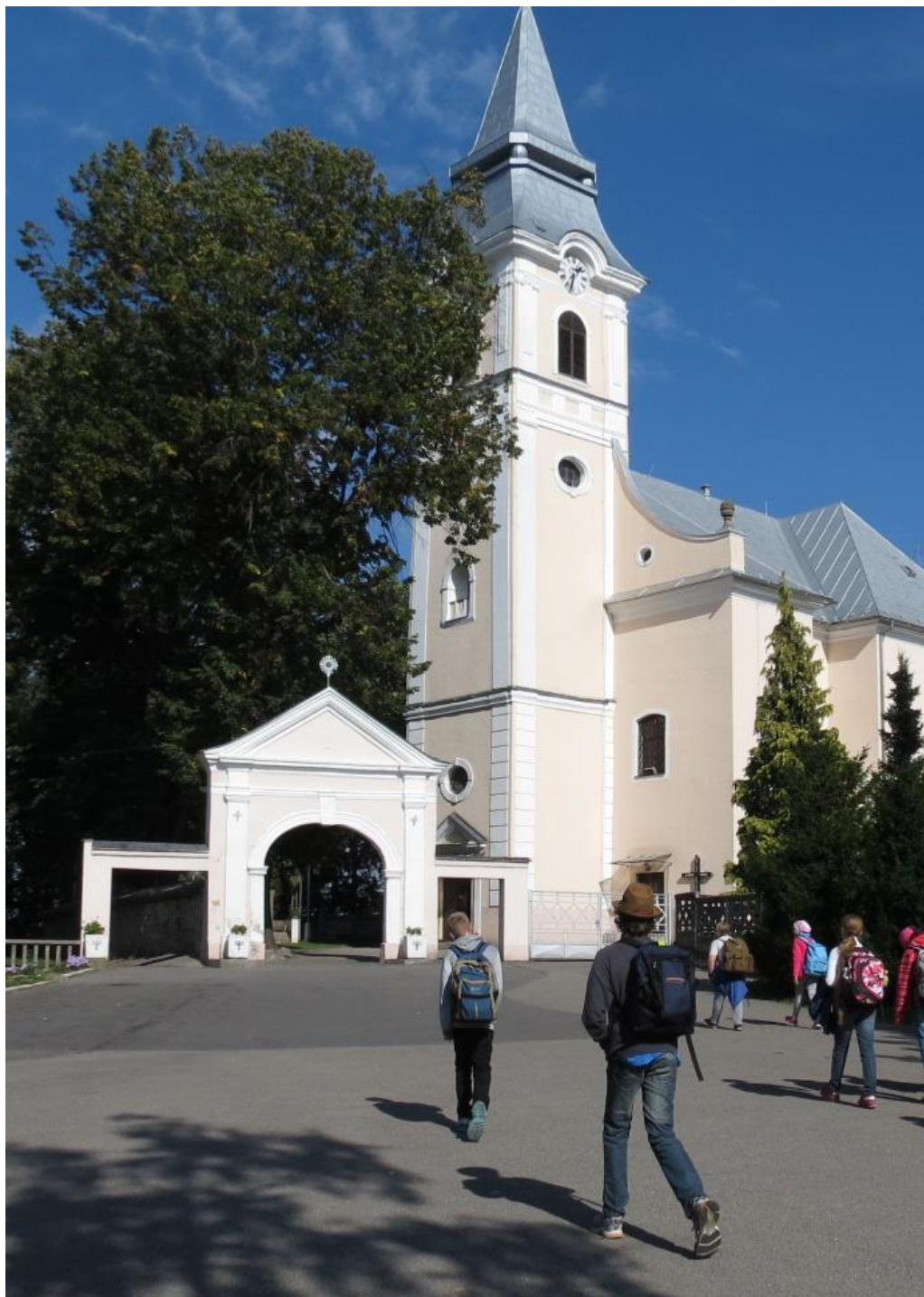
Kostol v Dubnici nad Váhom

Časopis nielen pre tých, ktorí majú radi históriu.