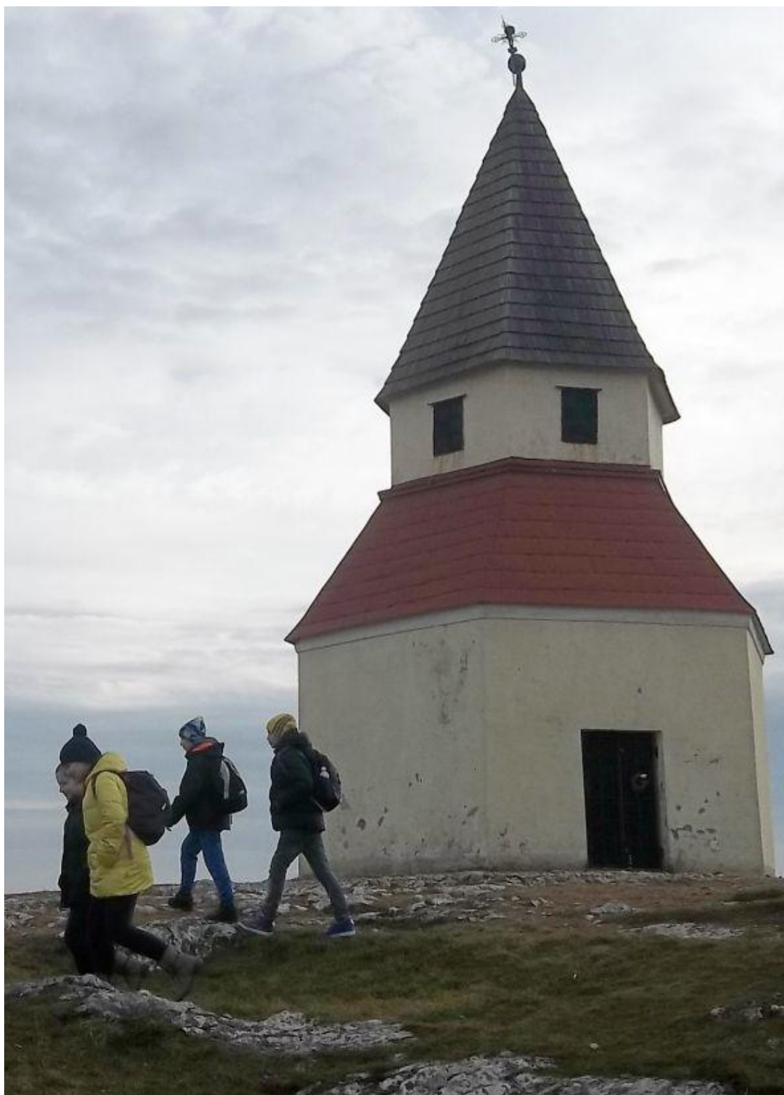
Na Nitrianskej kalvárii