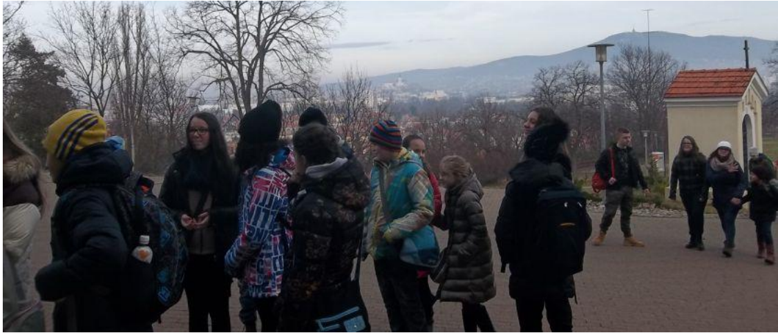
Pred misijným múzeom.

Ak neviete, čo je to misijné múzeum, ponúkame nasledujúce krátke vysvetlenie. Z pohľadu katolíckej, ale aj iných cirkví, je pre nich dôležité expandovať a získať vo svete čo najviac svojich stúpcov. Na tieto účely si katolícka cirkev vytvára (okrem iného) svoje misijné rády, ktoré potom pod rôznymi zámienkami prenikali a prenikajú do celého sveta. Treba však objektívne konštatovať, že dnes tieto misie konajú užitočnú a prospešnú činnosť (napríklad v zdravotníctve) v tých oblastiach sveta, ktoré to potrebujú. Misionári, ktorí pôsobili v zahraničí, dostávali od „domorodcov“ rôzne zaujímavé dary, ktoré z hľadiska dejín dokumentujú pre nás exotickú kultúru. Misijné múzeum je preto mimoriadne vhodným miestom, z hľadiska vyučovania dejepisu, na zoznámenie sa s originálnymi kultúrnymi predmetmi od Južnej Ameriky, cez Afriku až po Čínu a Japonsko. Ponúkame niekoľko fotografií: