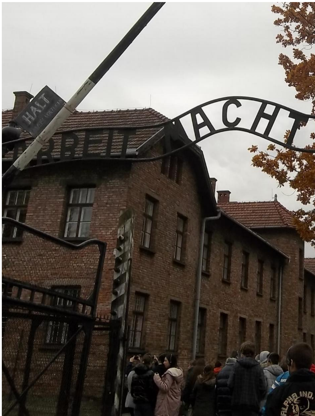
Vstupná brána do Osvienčimu.

Časopis nielen pre tých, ktorí majú radi históriu.